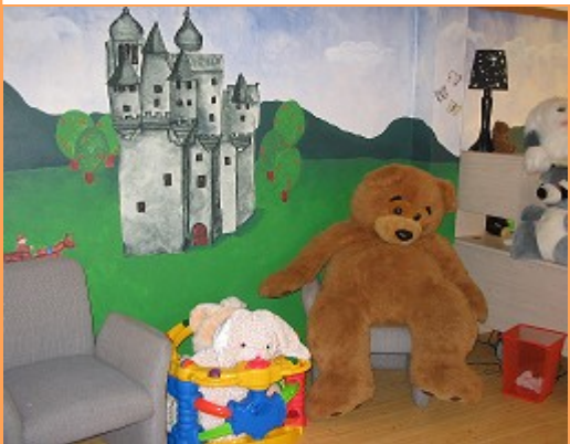
Columbia Gorge Child Advocacy Center entrance

April is Child Abuse Prevention month. Join the CGCAC and wear a blue ribbon to support the prevention of child abuse in our community.