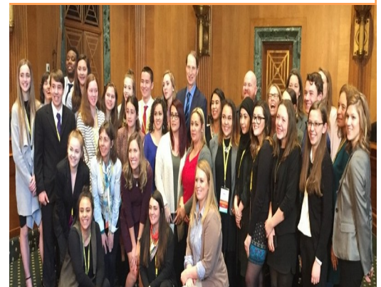
CADCA attendees visit with Senator Ron Wyden

CADCA dedica un día entero dedica un día entero de esta conferencia para visitar el Capitolio, lo cual permite a los participantes a visitar a sus congresistas y senadores y hablar con ellos sobre las situaciones que están teniendo en sus comunidades. La próxima conferencia será en Julio en Atlanta, Georgia. Esperamos llevar más miembros de la Coalición.