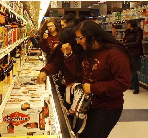
HRVHS Health Media Club add a prevention message to beer cartons for Super Bowl Sunday

Esta actividad se llevó el jueves antes del Super Bowl. Las tiendas que visitamos fueron Windmaster Market, Walgreens, Safeway, Rite Aid, Rosauers, Mercado Guadalajara, Mid Valley Market, Carnicería y Verdurería la Mexicana y Boys Pine Grove Grocery.